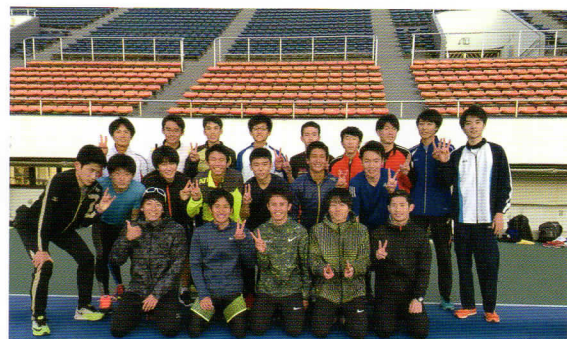
たくさん参加してくれました!! ありがとうございました★